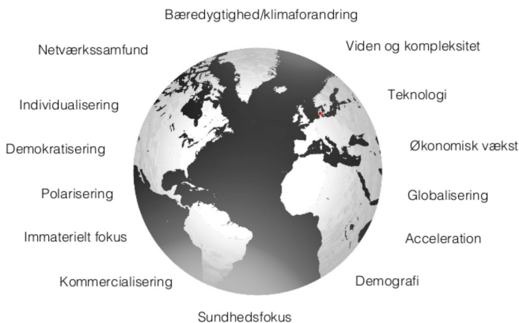
Figur 1, Globale Megatrends

Copenhagen Institute for Futures Studies Instituttet for Fremtidsforskning